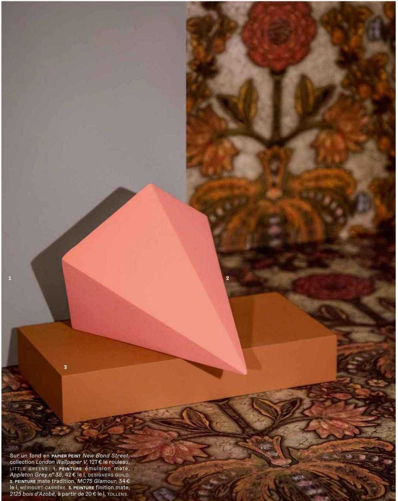
Sur un fond en PAPIER PEINT New Bond Street , collection London Wallpaper V , 127 € le rouleau, LITTLE GREENE. 1. PEINTURE émulsion mate, Appleton Grey n° 38 , 42 € le l, DESIGNERS GUILD. 2. PEINTURE mate tradition, MC75 Glamour , 34 € le l, MÉRIGUET-CARRÈRE. 3. PEINTURE finition mate, 2125 bois d'Azobé , à partir de 20 € le l, TOLLENS.