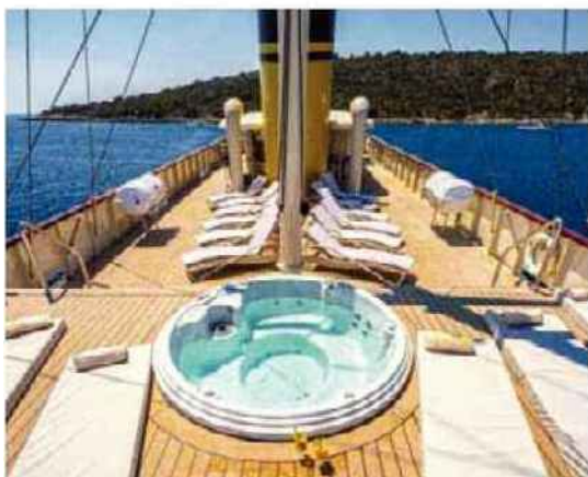
M/Y CASABLANCA

Yachting en Croatie: 9 nuits, à partir de 2 795 €/pers. (base 2), vols, transferts, pension complète, visites et excursions inclus. 01.55.87.85.99, www.maisondescroisieres.fr .