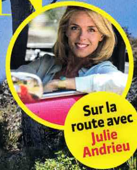
Sur la route avec Julie Andrieu

BALADE Au fil des méandres de la Loire, en Touraine