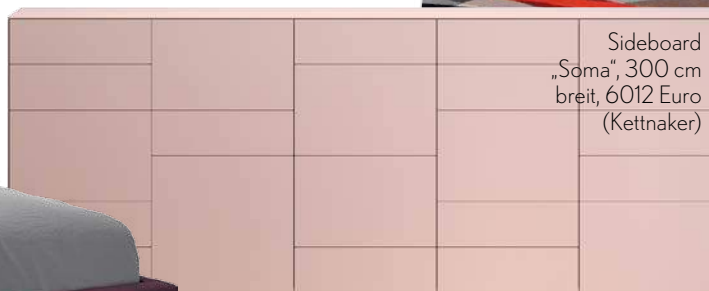
Sideboard „Soma“, 300 cm breit, 6012 Euro (Kettner)