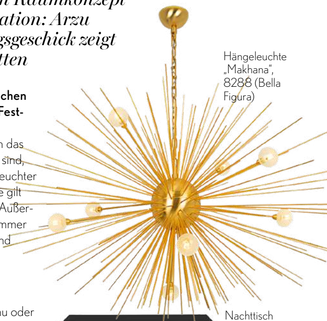
Hängeleuchte „Makhana“, 8288 (Bella Figura)

Dass nicht zu viel Schwarz auf dem Tisch dekoriert wird. Sonst wirkt es schnell düster. Was gut passt, sind natürlich Gold und Silber. So sieht das Ganze gleich sehr edel aus. Ich persönlich mag aber auch die klassische Schwarz-Weiß-Kombination, mit der macht man nie etwas falsch.