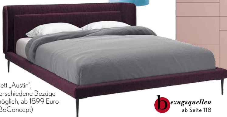
Bett „Austin“, verschiedene Bezüge möglich, ab 1899 Euro (BoConcept)