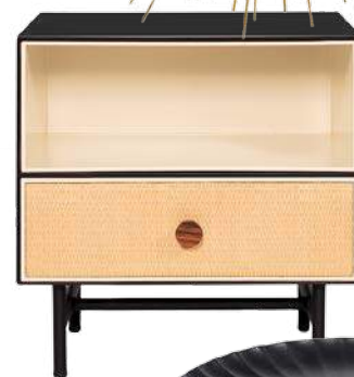
Nachttisch „Chevet Essence“, 990 Euro (Maison Sarah Lavoine)