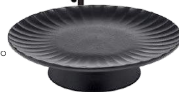
Servierschale „Inku“, 44 Euro (Serax)