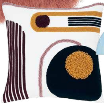
Kissenhüllen „Morten“ aus Kunstfell, 25 Euro, und „Allard“, 33 Euro (Westwingnow)