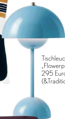
Tischleuchte „Flowerpot“, 295 Euro (&Tradition)