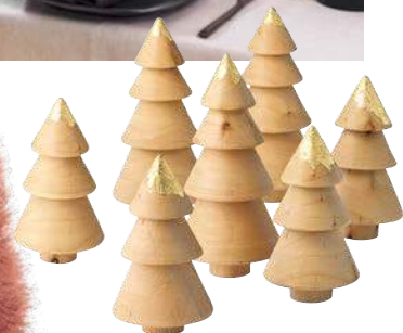
Weihnachtsbaum „Arbol“ aus Zirbelholz, ab 6 Euro (Philippi)