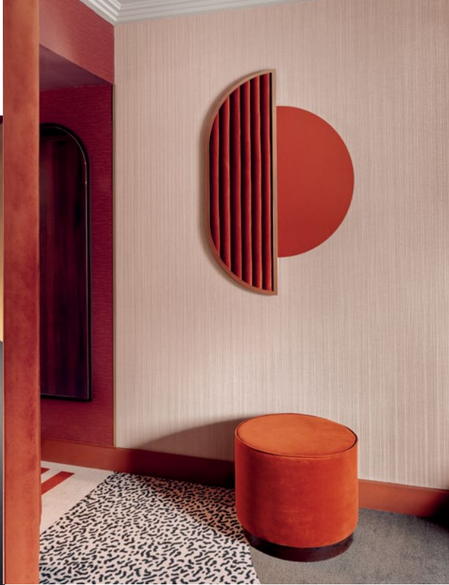
Ảnh trái Phòng tiếp tân liên kế tiền sảnh với màu sắc trang trí theo lối tương đồng. Ảnh trên Phòng ngủ lấy hình học làm phom dáng thiết kế chủ đạo.