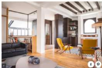
D'une taille généreuse, cette grande pièce de vie catalise deux salons au charme bien différent mais aussi un petit coin bibliobasique que l'architecte a souhaité intégrer en fluide au décor. Pour elle, l'ajout de cette bibliothèque légère permet de garder les lignes prospectives et la luminosité de la pièce. En effet, cette bibliothèque basse favorise une sensation de grandeur mêlée à un sentiment de luminosité, soutenu par la présence de grandes ouvertures vitrées...