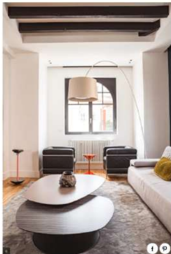
Parallèlement au coin bureau, de l'autre côté de la pièce dans une petite alcôve domine en maître un classique du design : le fauteuil LC2 signé Le Corbusier. Deux modèles se font face et créent un intéressant rapport de formes graphiques entre l'ouverture en arc et le style design rectiligne.